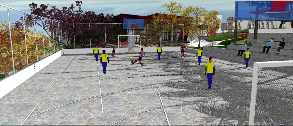
No Espaço de esporte as quadras poliesportivas tem aproveitamento da própria topografia para conformar as arquibancadas.

ionamento conta 52 vagas para carros, 10 vagas to e 10 vagas para bicicleta foram calculados ne exigido Plano Diretor de Criciúma.Os ários ficaram distribuídos nas entradas do Centro l, para manter sempre no nível dos acessos. Na e saída do estacionamento, haverá cancela tica para manter o controle. O depósito servirá rga e descarga do estacionamento, prevendo o uso inhões de pequeno e médio porte. Tendo namento acompanhado a topografia, os elementos s possibilitam a ventilação do mesmo. Os res e as plataformas elevatórias serão hidráulicos e edificação se consolida em três pavimentos.