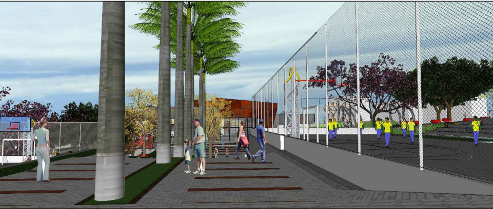
Na perspectiva do eixo norte-sul em direção ao Centro Cultural, observa-se a marcação do caminho pelas palmeiras imperiais e pela marcação de piso.