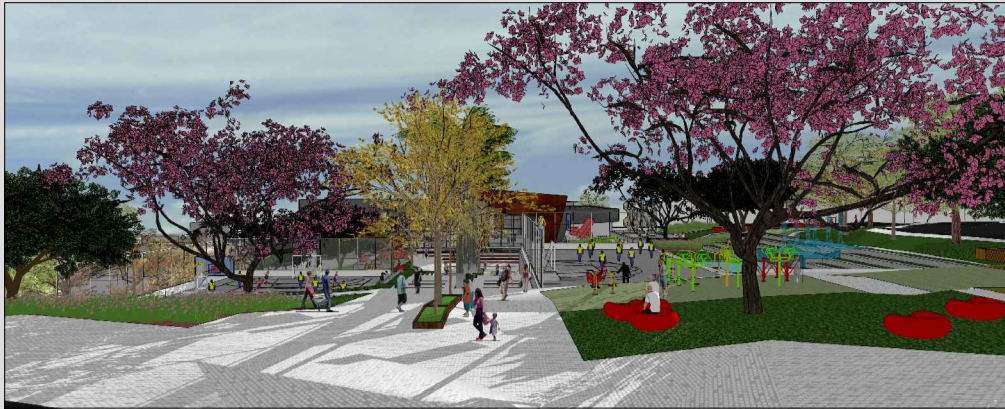
Perspectiva de quem vem da escola e segue pelo eixo norte-sul em direção ao Centro Cultural, sendo esse caminho marcado com sequência linear de árvores e palmeiras. Ao longo do eixo nota-se : (1) o espaço de lazer com bancos soltos, (2) academia e (3) quadra poliesportiva