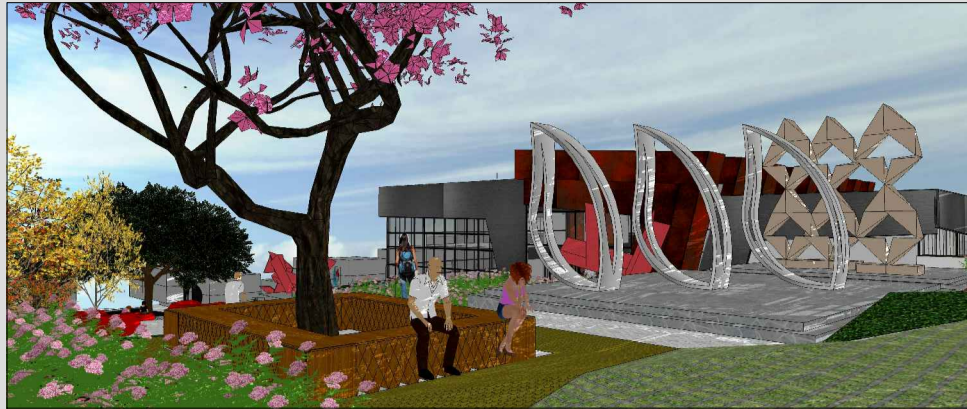
No Espaço de lazer, os bancos fixos com a proposta de árvores com folhas caducas para sua utilização também no inverno e ao fundo a área de exposição da galeria, marcando o eixo leste/oeste.