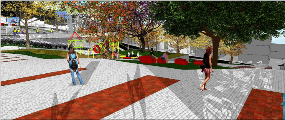
Na perspectiva observa-seo espaço de lazer com a proposta de bancos soltos, árvores com folhas perenes e ao fundo o espaço de playground, também tendo a utilização de árvores de copas densas para proporcionar sombra.