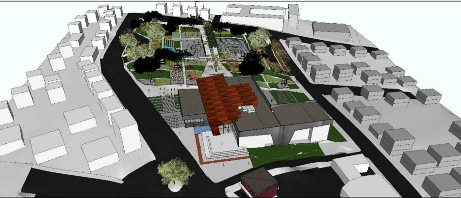
Perspectiva geral da proposta